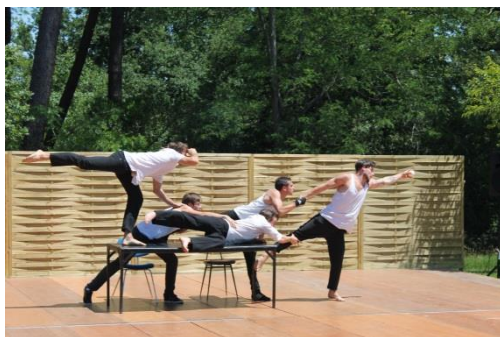
Echappée belle 2014

Sur Bordeaux, le Centre de Formation a tissé des partenariats forts (cours mutualisés, masterclass collectives...) avec d'autres structures d'enseignement artistique supérieur notamment le centre de formation de la Cie Révolution, Lullaby et l'ESTBA (Ecole Supérieure de Théâtre de Bordeaux en Aquitaine).