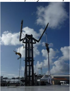
Salon Nautique Arcachon 2014