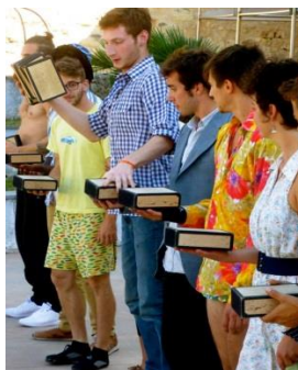
Champ de foire 2014