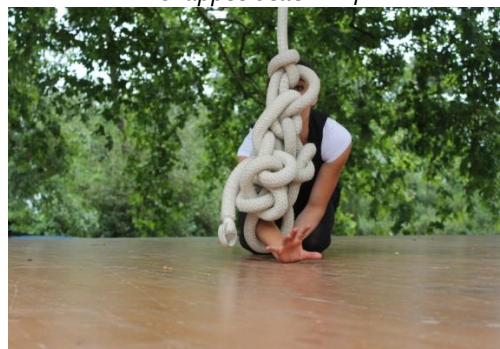
Echappée belle 2014