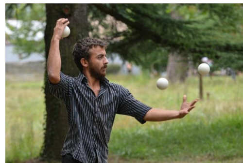
Champ de foire 2014