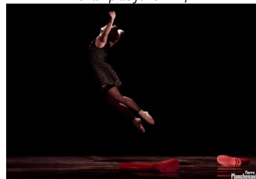
Festival 30'30' 2015